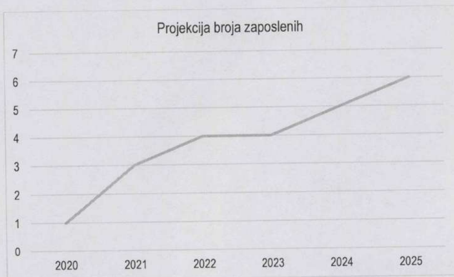
Grafički prikaz: Plan kretanja broja zaposlenih po godinama

Planirano kretanje broja zaposlenih prikazano je grafičkim prikazom u nastavku, a odnosi se na period od 2020. g. - 2025. g. Grafički prikaz prikazuje povećanje broja zaposlenih u odnosu na prethodne godine (prosječan broj zaposlenih) što je rezultat restrukturiranja tvrtke i povećanja prodaje do kojeg je došlo kroz projekciju budućeg poslovanja tvrtke.